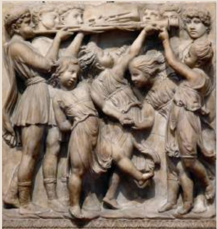
Luca della Robbia, Cantoria (1431)